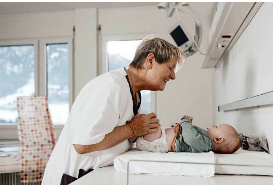
Hier lässt es sich wohlfühlen! Aufmerksame Betreuung durchs Hebammen-Team

All die Fachexpertise der Hebammen, die Spezialisierung auf das feinsinnige, rücksichtsvolle Handeln im Umfeld der Geburtsthematik – die interdisziplinäre Zusammenarbeit mit Pflorgeteam, Fachärzt*innen, Physiotherapie – haben das eine zum Ziel: Dass Eltern gestärkt und voller Vertrauen in ihren neuen Alltag zu Hause starten können.