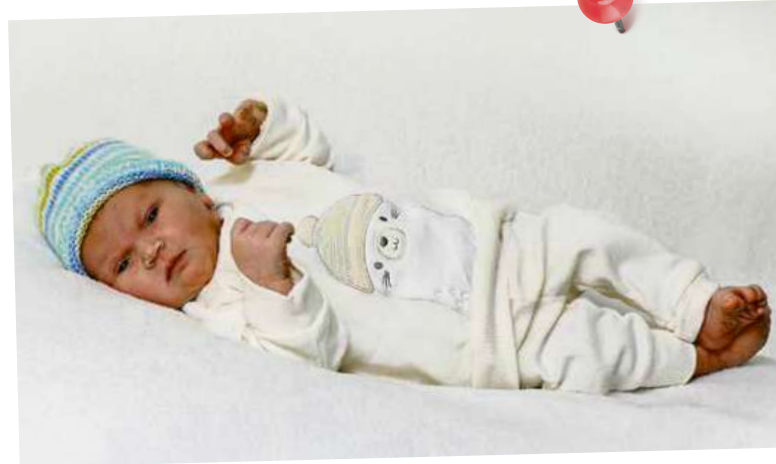
1. Baby 2026: Andrea | 1. Januar um 20.16 Uhr 3900 g | 53 cm

Dieses Jahr sind alle Skigebiete der Region vertreten und ein verbindender Apéro krönt den Abschluss des Anlasses. War toll mit euch!