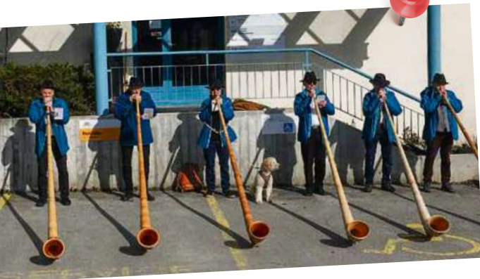
Tag der Kranken 2026

Die Stadtmusik und Alphorngruppe Illanz spielen bei schönstem Wetter am 1. März, dem offiziellen «Tag der Kranken», für alle Patient*innen. Herzlichen Dank dafür!