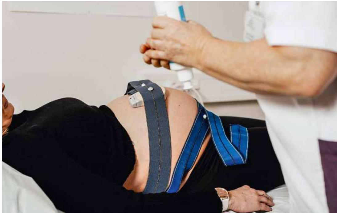
Untersuchung während der Schwangerschaft