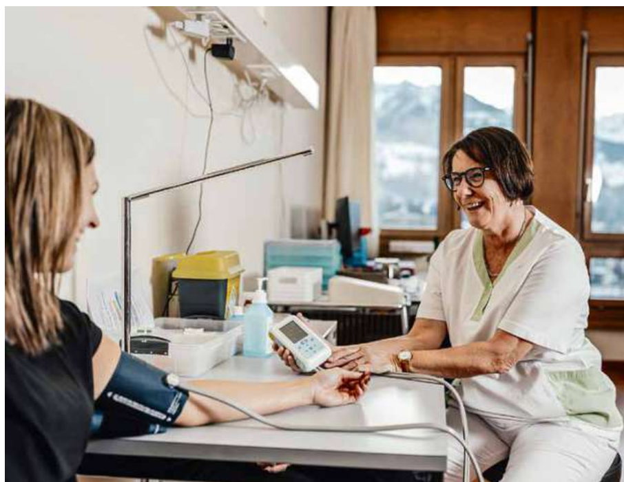
Blutdruckmessung zur Kontrolle

Genauso persönlich begleiten die Hebammen bei der Wahl einer geeigneten Schmerzlinderung. Oft erzielen bereits die richtige Atemtechnik, Massagen, Akupunktur, warme Wickel, oder ein entspannendes Bad in Kombination mit Homöopathie oder Anthroposophie grosse Wirkung. Ergänzend informiert wird situationsangepasst über den Einsatz von Lachgas und medikamentöse Möglichkeiten bis hin zur PDA (Periduralanästhesie).