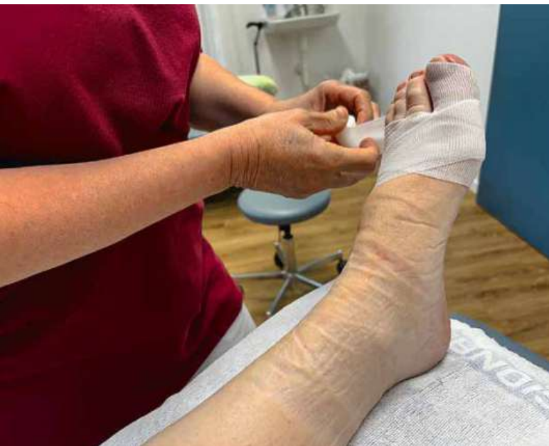
Kompression (li. oben) und Lymphdrainage (re. unten) als Therapieoptionen

Wenn die Hausärztin oder der Hausarzt eine behandlungswürdige Lymphproblematik feststellt, kann die Kompressionsbehandlung und manuelle Lymphdrainage verordnet werden. Dies soll durch eine*n in diesen Massnahmen spezifisch ausgebildete*n Physiotherapeut*in erfolgen!