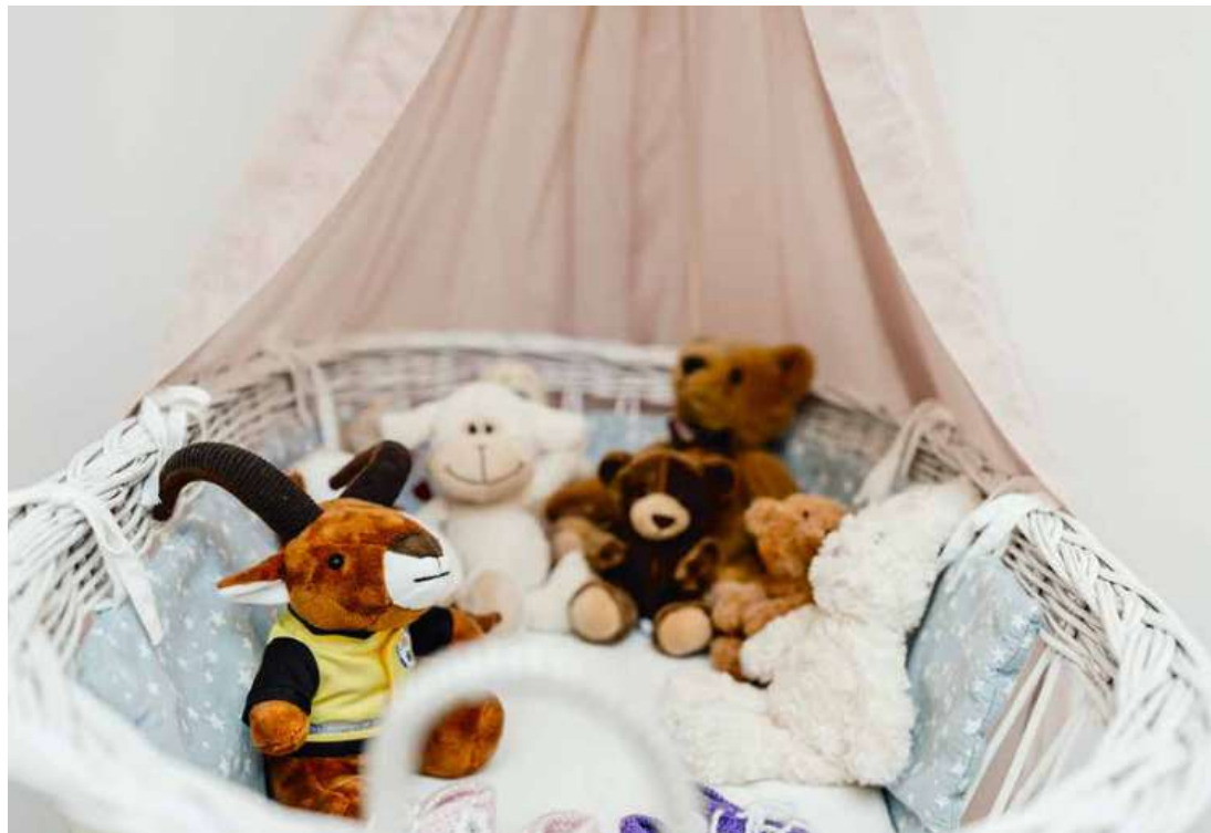
Warmherzige Atmosphäre: Kuscheltiergruppe auf der Geburtshilfeabteilung