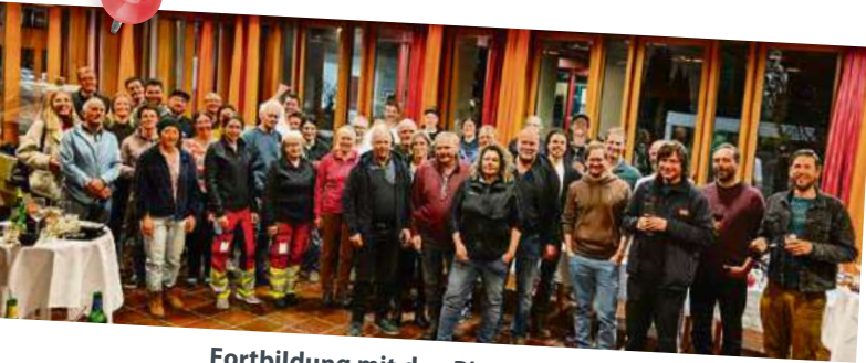
Fortbildung mit den Pistenrettungsdiensten am 26. März:

Dieses Jahr sind alle Skigebiete der Region vertreten und ein verbindender Apéro krönt den Abschluss des Anlasses. War toll mit euch!